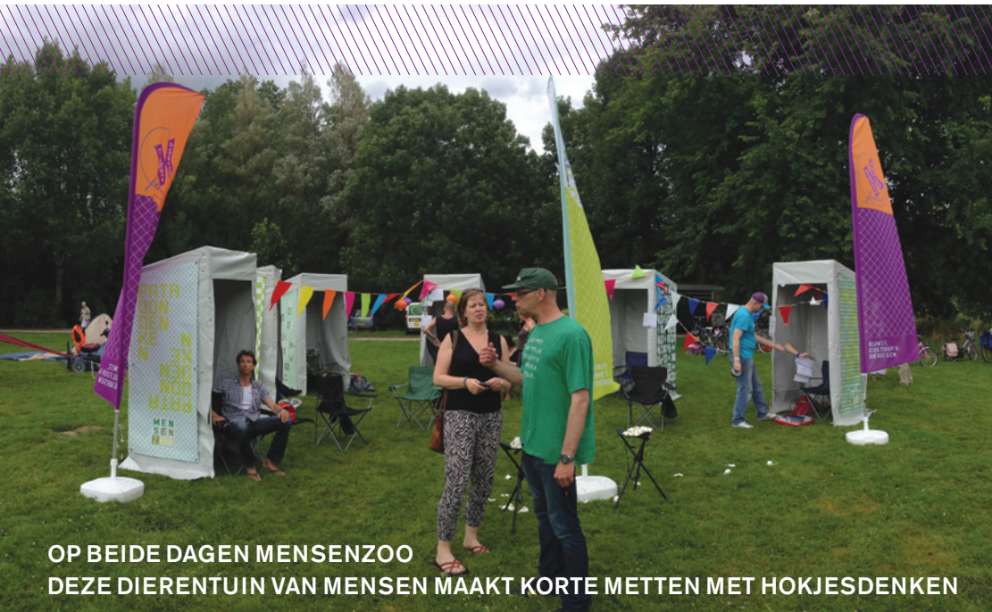
OP BEIDE DAGEN MENSENZOO DEZE DIERENTUIN VAN MENSEN MAAKT KORTE METTEN MET HOKJESDENKEN

HET KWARTIERMAKERSFESTIVAL BIEDT EEN PODIUM VOOR TALENTEN. HET WERKT MEE AAN EEN POSITIEVE KIJK OP MENSEN MET IEDER HUN EIGEN AARDIGHEID. BEKIJK AL ONZE ACTIVITEITEN OP WWW.KWARTIERMAKERSFESTIVALARNHEM.NL VOLG ONS OOK OP FACEBOOK.COM/KWARTIERMAKERSFESTIVALARNHEM EN OP TWITTER @KWARTIERMAKEN