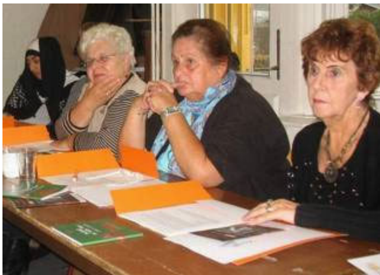
Voorlichting voor medewerkers en vrijwilligers buurtcentra

Deze praktijk is eigenlijk overal toepasbaar waar mensen te maken hebben met uitsluiting, waar mensen niet zo makkelijk hun weg vinden in de samenleving, zoals naar buurtcentra en sportclubs. Ze is goed overdraagbaar als men de uitgangspunten van Kwartiermaken serieus neemt: oog hebben voor enerzijds het anders-zijn van kwetsbare groepen en anderzijds de gewone verlangens van bijzondere groepen om mee te doen en erbij te horen. De begrippen 'gastvrijheid' (voor het vreemde, het anders-zijn) en 'opschorting' van het gewone om iets buiten het gewone te doen voor een buitengewone ander, zijn hier essentieel. Kwartiermaken brengt tot uitdrukking dat sociale integratie van mensen met beperkingen niet vanzelf gaat, al wonen de betrokkenen in de wijk. Sociale integratie vraagt om een bijzondere inspanning. Anders loopt vermaatschappelijking dood in assimilatie dwang of isolement.