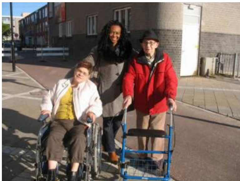
Zondagmaatje met bewoners Cordaan Borgerstraat op weg naar het zondagprogramma in de Klinker

Binnen kwartiermakersprojecten gericht op mensen met een psychiatrische achtergrond is de uitdrukking bekend: 'Ik blijf binnen, buiten doet zeer'. Deze ervaring van geïsoleerde en kwetsbare mensen vraagt om een presentieachtige benadering om hen uit hun isolement te halen, bijvoorbeeld door eerst thuis met hen contact te leggen (zie ook Van Bergen en Sok, 2008) – of misschien bij hen op de 'werkvloer', waar zij vaak wel te vinden zijn. Dat vergt een verdergaande investering dan nu binnen het project is voorzien. Misschien is het mogelijk dat MEE hierin een sterkere rol op zich neemt (zie ook Kal, 2004a). Deze outreachende en presentieachtige werkwijze lijkt ook van belang om mensen met een migrantenverleden te bereiken. Het taboe dat in Turkse en Marokkaanse kringen rust op het hebben van een handicap, vraagt om een extra zorgvuldige benadering (zie ook Kal, 2004b en 2004c).