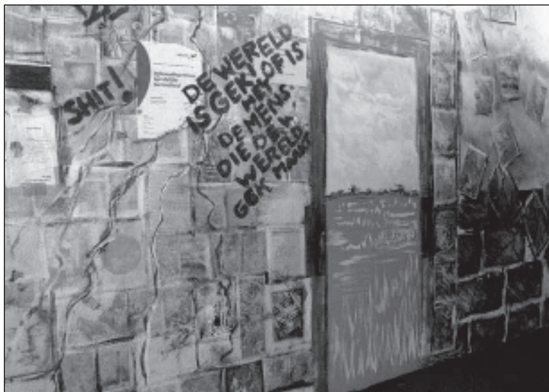
Kunst van cliënten van Altrecht

Het gevaar van economiseren speelt: geestelijke gezondheid wordt in het economisch imperium ondergebracht. Geestelijke gezondheid heeft nu eenmaal een steeds belangrijker economische dimensie. Deze expliciet maken en onderzoeken, was het doel van het rapport. Voor mij is daarmee de bescherming van geestelijke gezondheid het beste gediend.